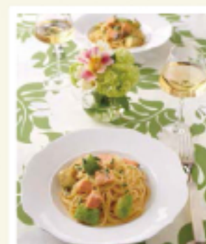
テーブルコーディネート例

「お皿の中の食材色を使ったテーブルクロスを選ぶと、全体にまとまりが出て落ち着きます。今回は初夏のすがすがしい爽やかなイメージを出すため、アボカドの色からグリーンを選びました。」